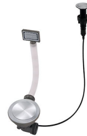
VIDAGE FADE PUSH INOX A407 A16