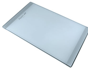
PLANCHE DE DECOUPE CRYSTAL 23x41 CM

* uniquement en combinaison avec l'accessoire A644 F04