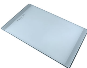
PLANCHE DE DECOUPE CRYSTAL

* uniquement en combinaison avec l'accessoire A644 F04