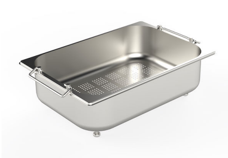
CUVETTE PERFOREE INOX A154 F00

* uniquement en combinaison avec l'accessoire A644 F04