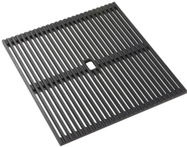
GRILLE NOIRE POUR EVIERS RIVA A100 E02