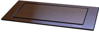
SUPPORT DE PRISE VERSO COPPER A000 A18