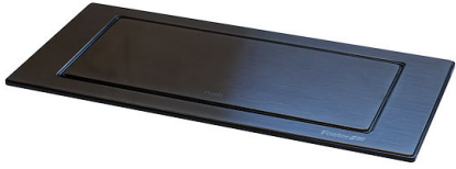
SUPPORT DE PRISE VERSO GUN METAL A000 A16