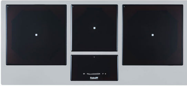
TABLE CUISSON INDUCTION GEMMA LIGNE INOX