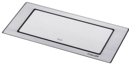
SUPPORT DE PRISE VERSO INOX A000 F10