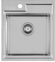
SOLO 365 N151 F50