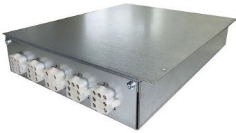
CONNECTION BOX 4 FOYERS I369 B40