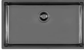
UNIKA 710 GUN METAL N157 F56